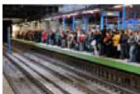
Andén lleno durante el paro.

El consejero Echeverría decreta servicios mínimos del 50% para la huelga de Metro de 28, 29 y 30 al no haber acuerdo entre la gerencia de la empresa y los representantes de los trabajadores.